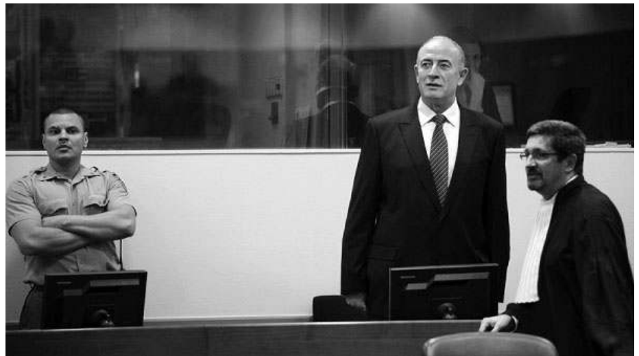
Veselin Šljivančanin u haškoj sudnici: ni danas se ne kaje zbog zločina

Tu se ne radi ni o kakvim osobnim simpatijama ili antipatijama, nego o nacionalno-političkoj dimenziji toga suđenja, i o elementarnim pravima optuženika i njihovih obitelji. U tom postupku, koji ih je već svojim maratonskim trajanjem unaprijed pretvorio u osuđenike i dokinuo im prak-